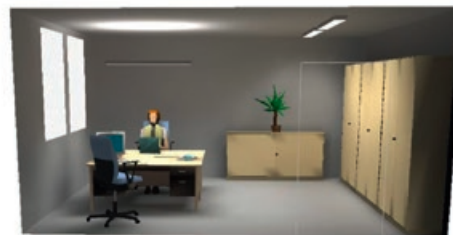
3D-Darstellung des obigen Raumes

Falschfarbendarstellungen ermöglichen es, auch geringe Unterschiede (hier Helligkeitsunterschiede) deutlich sichtbar zu machen.